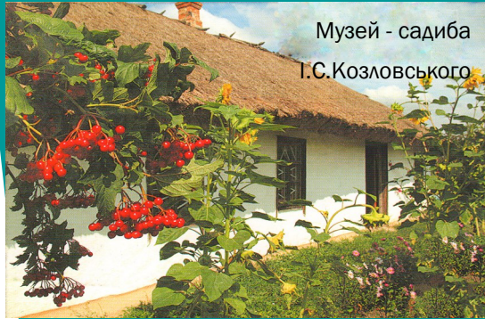
Музей - садиба І.С.Козловського

Музей-садиба Івана Козловського — це мальовнича казка в центрі села, ніби в іншому часі та вимірі.